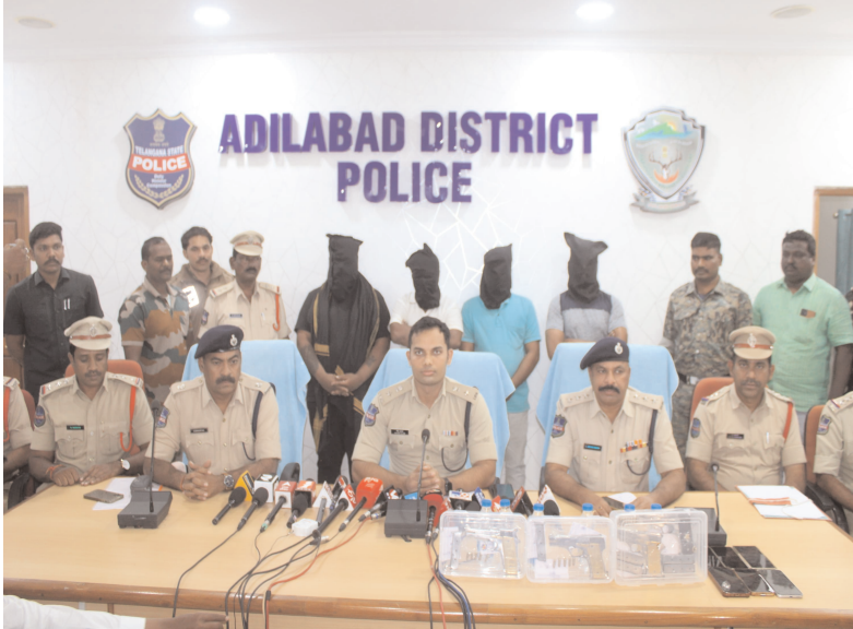
అంతర్జాతీయ సంఘటనాశీలకతల విరూపిణులను విచ్ఛిన్నం చేసిన ఆదిలాబాద్ జిల్లా పోలీసులు...